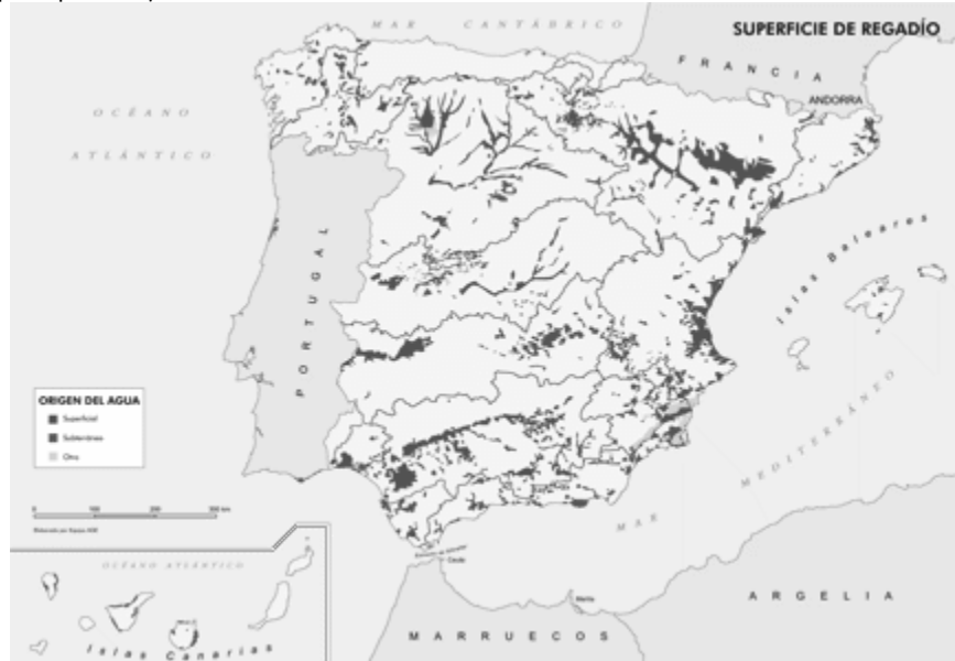
Imagen del Atlas Nacional de España en ign.es. bajo licencia CC