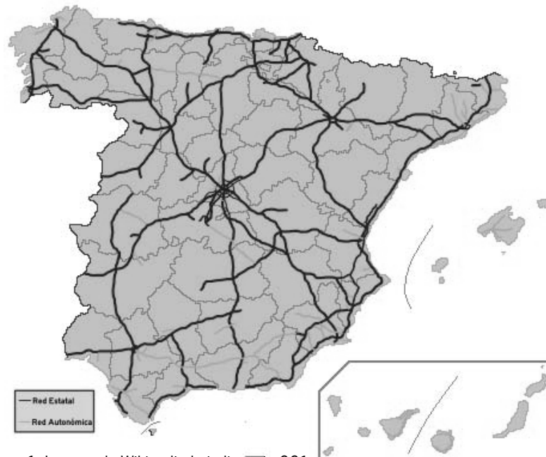
Mapa 1. Imagen de Wikipedia bajo licencia CC1

5. Los siguientes mapas muestran la red española de autopistas y autovías en el año 2011 (Mapa 1) y la red ferroviaria española en el año 2012 (Mapa 2) (2,5 puntos; 0,5 por apartado)